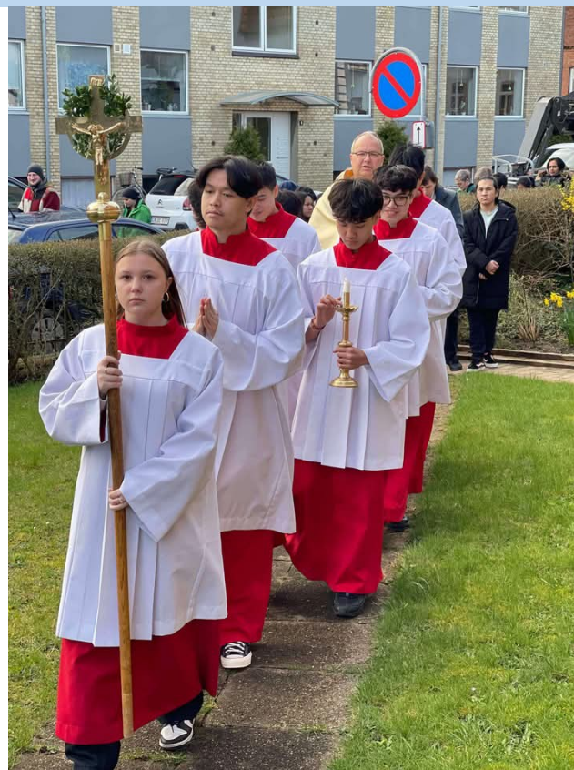
Skærtorsdag — sakramentet føres til det midlertidige sakramentskappel i menighedssalen