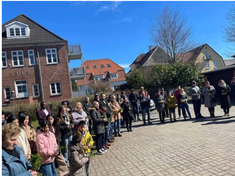
Palmesøndag — velsignelse af ”palmegrene”